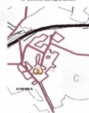
9. Схема захоронения