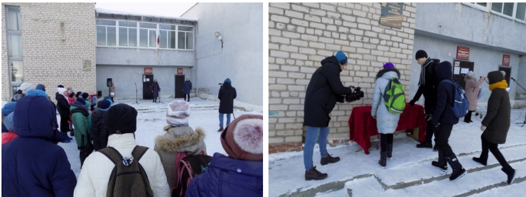
У памятной доски Героя Советского Союза Е.М. Гребенюка