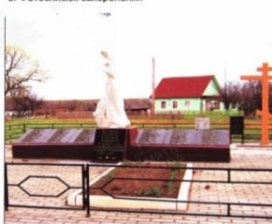
8. Фото снимок захоронения