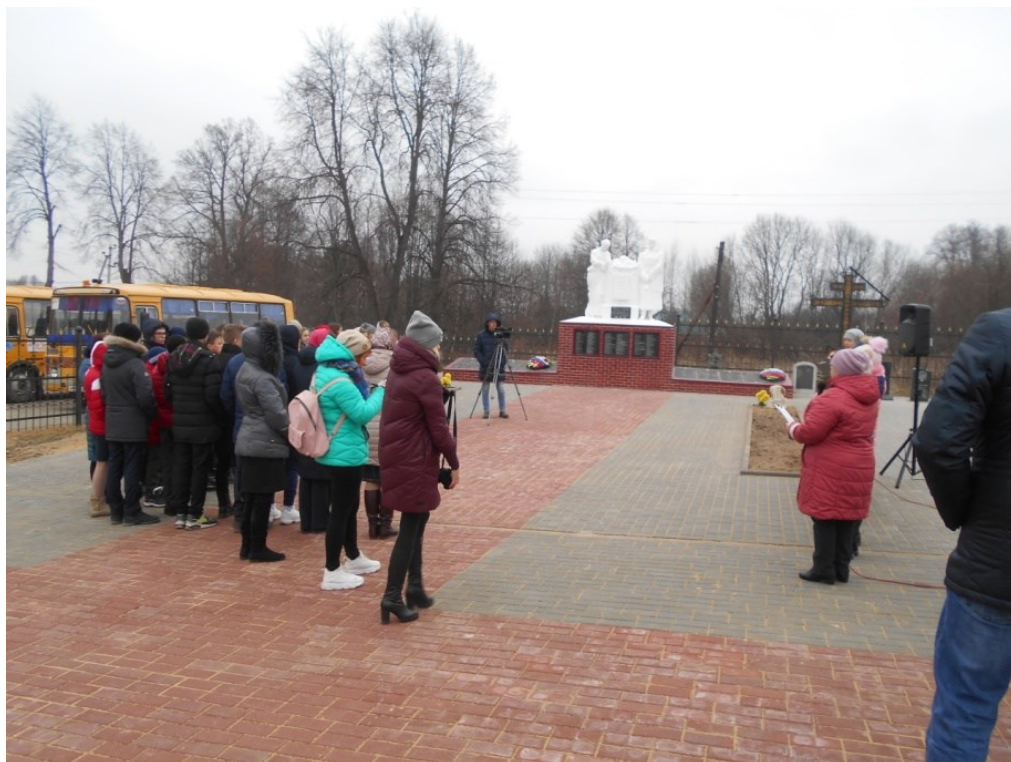
Митинг у братской могилы С. Фоминичи