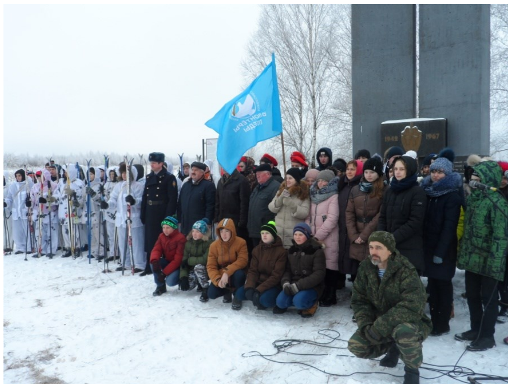
23 января День памяти лыжников-чекистов в д. Хлуднево