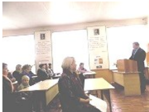
Информация и фото предоставлены заместителем директора по УВР Талагаевой Г.В.

чеством образовательных услуг, который представит в отдел образования. Кроме этого, родители выбрали представителей Родительского комитета школы. В целом, собрание прошло в атмосфере конструктивного диалога педагогов школы и родителей.